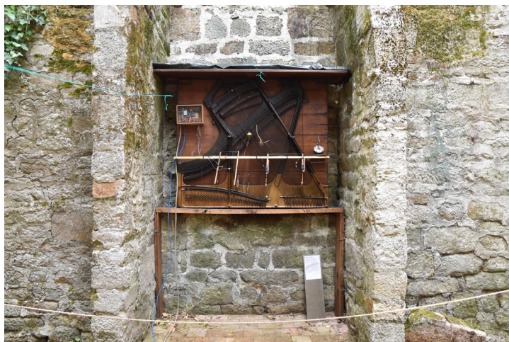
© Dominique Leroy - (n) et Kerminy