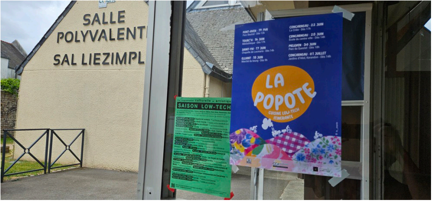
Test d'affichage public de la Saison low-tech.